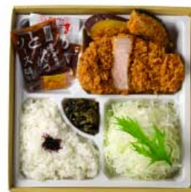
ローズかつ弁当 80g 1,000円 120g 1,300円 160g 1,600円 【卵・乳成分・小麦】