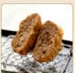
ミンチかつ 1個 420円 【卵・乳成分・小麦】