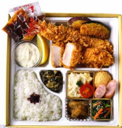
あじさい 紫陽花弁当 2,080円 (季節のおばんざいと、大海老かつ・ヒレかつ) 【卵・乳成分・小麦・えび】

春夏秋冬、 季節のめぐみをおばんざいに、 自慢のとんかつに添えた バランスの良いお弁当です。 京都の四季も堪能できる お弁当、会議やお宅でも。