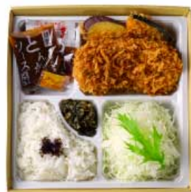
ヒレかつ弁当 80g 1,200円 120g 1,500円 160g 1,800円 【卵・乳成分・小麦】