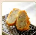
豚そぼろコロッケ 1個 260円 【卵・乳成分・小麦】