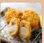
帆立かつ【青森県産】 1個 150円 【卵・乳成分・小麦】