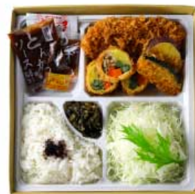
季節野菜の湯葉巻きかつと ヒレかつ弁当 1,560円 【卵・乳成分・小麦】