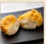
蟹クリームコロッケ 1個 560円 【卵・乳成分・小麦・えび・かに】