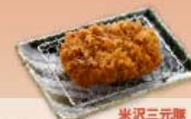
米沢三元豚 ヒレかつ 40g 600円 80g 900円 120g 1,200円 160g 1,500円 【卵・乳成分・小麦】