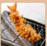
海老かつ 1尾 380円 【卵・乳成分・小麦・えび】