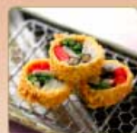
野菜の湯葉巻きかつ 1個 460円 【卵・乳成分・小麦】