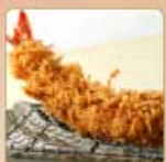
大海老かつ 1尾 980円 【卵・乳成分・小麦・えび】