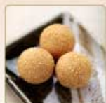
ごま団子 3個 200円 【卵・乳成分・小麦】