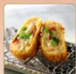
季節の豆乳コロッケ 1個 420円 【卵・乳成分・小麦】