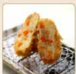
野菜コロッケ 1個 260円 【卵・乳成分・小麦】