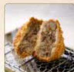
肉じゃがコロッケ 1個 260円 【卵・乳成分・小麦】