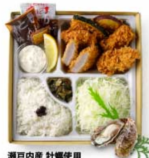
瀬戸内産 牡蠣使用 牡蠣フライとヒレかつ弁当 1,680円 【卵・乳成分・小麦】