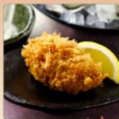
瀬戸内産 牡蠣フライ 1個 350円 【卵・小麦】