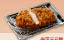
米沢三元豚 ローズかつ 80g 700円 120g 1,000円 160g 1,300円 【卵・乳成分・小麦】